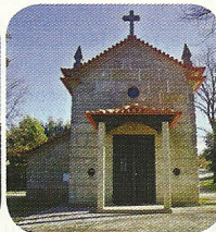
Capelinha de Santa Ana