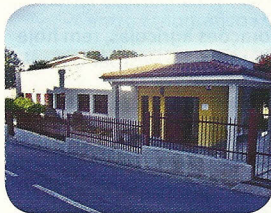
Junta de Freguesia