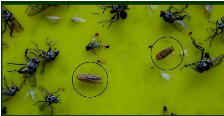
Insetos adultos de Scaphoideus titanus capturados na armadilha (dentro do O - medem cerca de 5 mm)