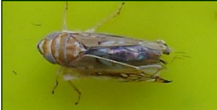
Inseto adulto de Scaphoideus titanus em imagem muito ampliada (notar as bandas castanho-claro, na cabeça e no tórax)

Para combate à cigarrinha da FD no Modo de Produção Biológico , foi autorizado o produto ALIGN , à base de azadiractina .