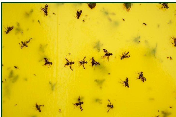
Adultos de mosca da casca verde da noz capturados na armadilha (imagem em tamanho próximo do natural)

Devem ser retirados dos pomares todos os frutos de refugo. Os frutos de refugo são podem ter múltiplos aproveitamentos - compotas, vinagre de fruta, licores. Os últimos refugos podem ser usados na alimentação de aves de capoeira, distribuindo-os em pequenas quantidades de cada vez, de forma a reduzir a possibilidade de escaparem algumas larvas de drosófila que possam ter.