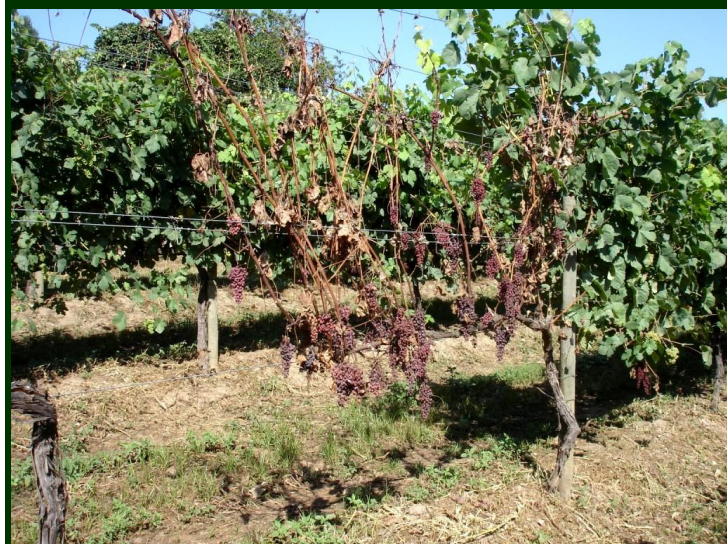
Forma rápida de evolução da esca (no início do verão)

Consulte a Ficha Técnica nº 55 (I Série/ DRAEDM)