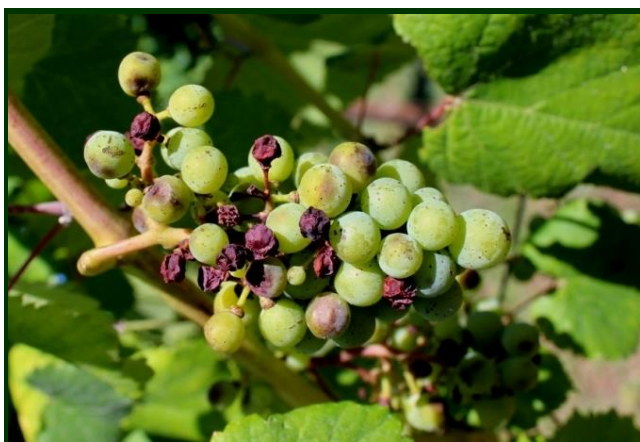
Míldio de verão nos bagos (rot-brun)

O IPMA prevê a possibilidade de chuviscos ou chuva fraca, para o próximo dia 19 de julho.