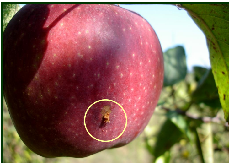
Bichado em maçã (2ª geração) – perfuração recente

Consulte a Ficha técnica nº 37 (II Série/ DRAPN)