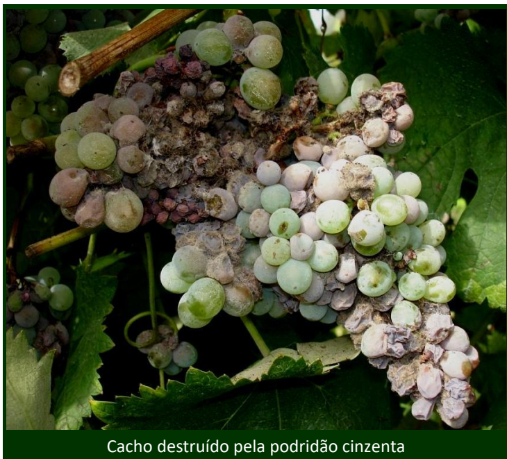
Cacho destruído pela podridão cinzenta

Para combate ao oídio da videira no Modo de Produção Biológico , são autorizados fungicidas à base de enxofre.