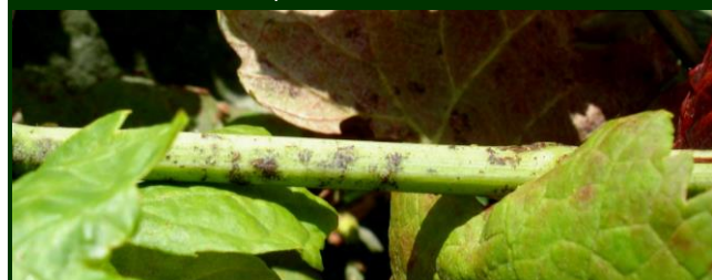
Oídio na vara ainda verde ↑ e na vara atempada ↓