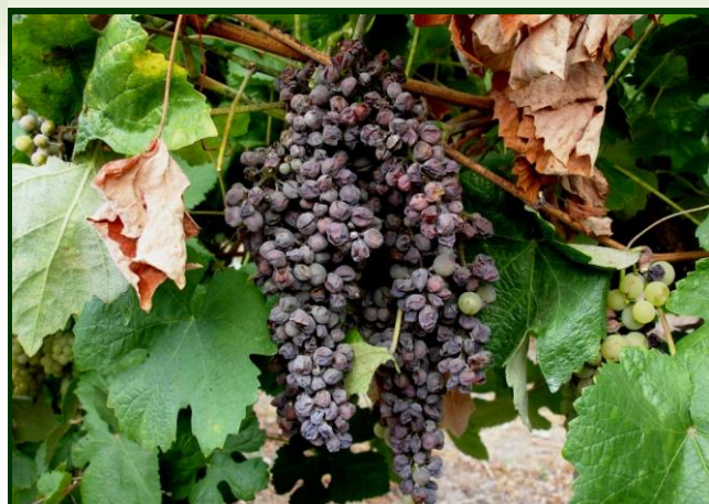
Cachos destruídos pelo oídio em videira mal cuidada

Consulte a Ficha técnica Nº 110 (I Série/DRAEDM) e a Ficha técnica Nº 8 (II Série/ DRAPN)