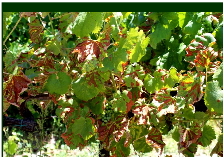
Forma lenta de evolução da esca (sintomas visíveis nesta época do ano)

Não existe tratamento conhecido para a síndrome da esca.