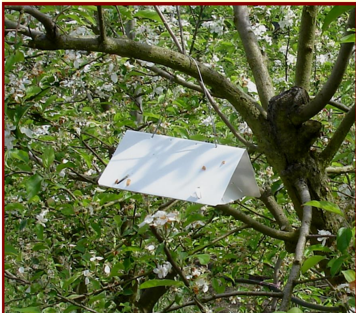
Um dos diversos modelos que podem ser usados na monitorização da mosca do mediterrâneo