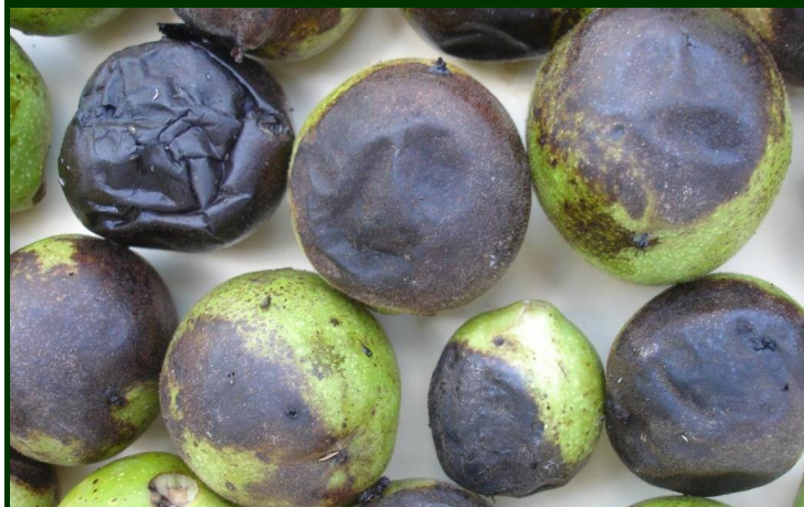
Sintomas exteriores de ataque de larvas da mosca da casca verde nas nozes