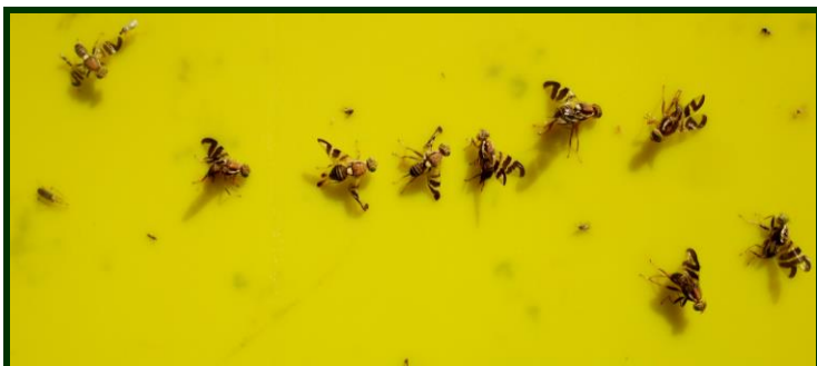
Mosca da casca verde da noz (imagem das moscas em tamanho próximo do natural)

As moscas são fáceis de identificar na armadilha: