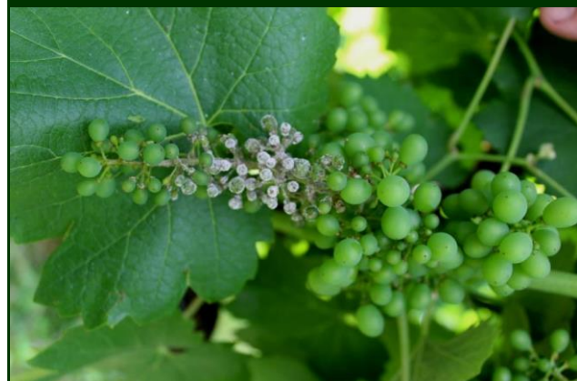
Míldio esporulado no cacho (rot-gris)

Para combate ao míldio da videira no Modo de Produção Biológico , são autorizados produtos à base de cobre .