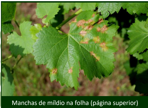
Manchas de míldio na folha (página superior)

Devem prosseguir as desfolhas e despampas moderadas, permitindo a circulação do ar em torno dos cachos e a penetração das caldas fungicidas.