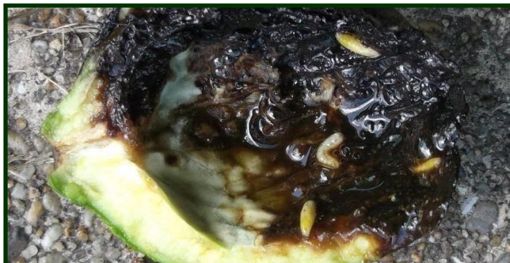
Larvas da mosca da casca verde da noz

Para organizar o combate a esta praga, deve fazer-se o controlo do voo , colocando no pomar armadilhas cromotrópicas amarelas e observando-as regularmente (3 vezes por semana) para detetar as primeiras capturas e a sua evolução.