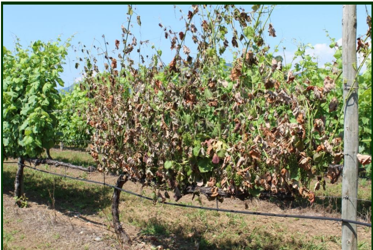
Morte repentina de videira afetada pela esca

Não existe tratamento conhecido para a síndrome da esca.