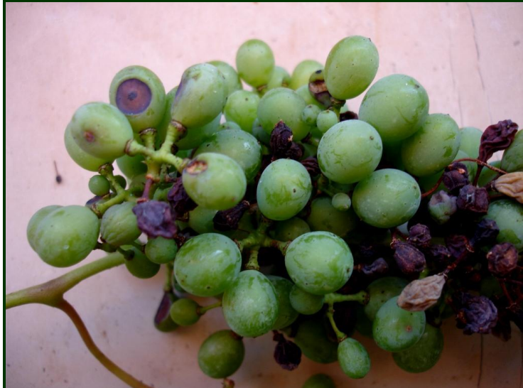
Sintomas de Black-rot no cacho