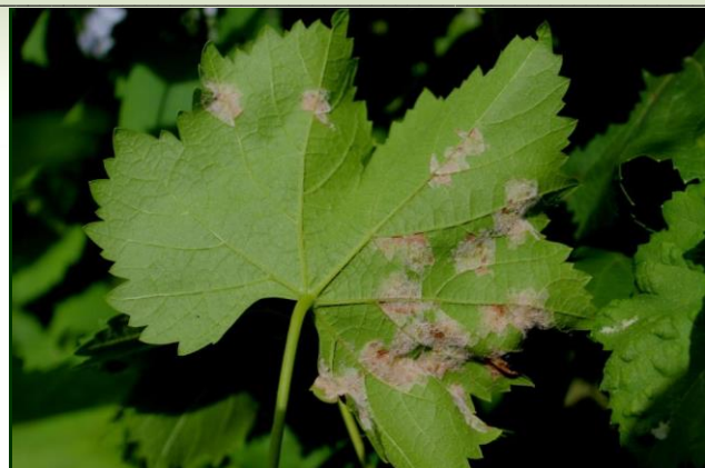
Manchas de míldio esporulado na folha (página inferior)