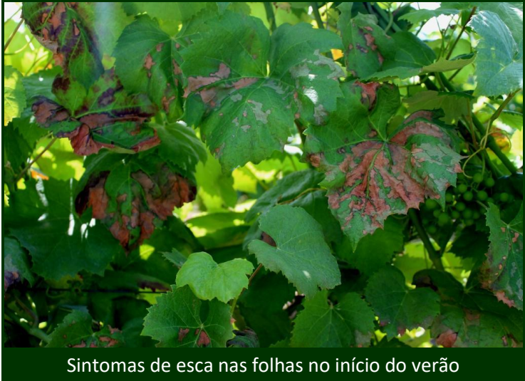
Sintomas de esca nas folhas no início do verão