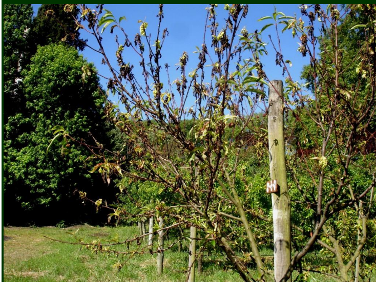
Sintomas de cancro de Fusicoccum em pessegueiro