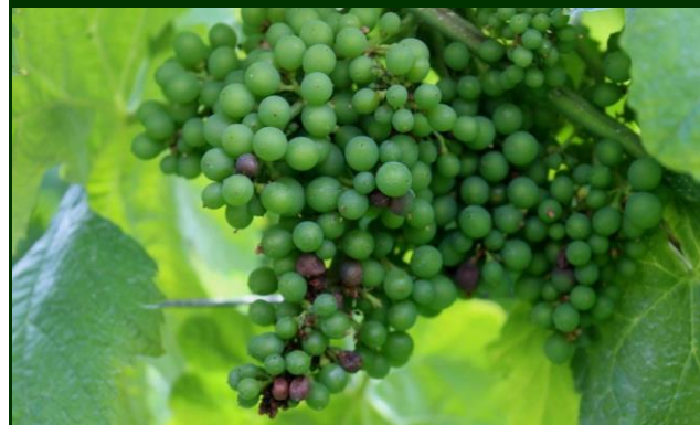
Míldio no cacho no início de julho (rot-brun)