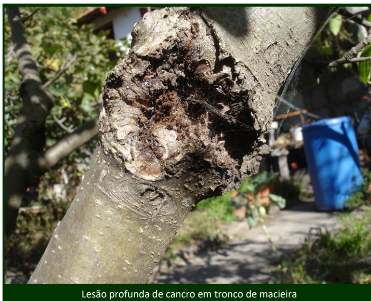
Lesão profunda de cancro em tronco de macieira

Neste período do ano, não é necessário aplicar qualquer produto desinfetante ou cicatrizante, pois as feridas cicatrizam com facilidade.