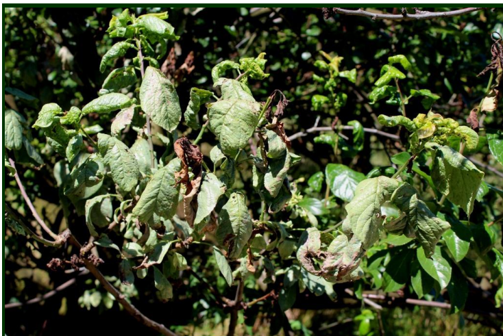
Sintomas da doença do chumbo em ameixeira

coberto, ao abrigo das chuvas. Estas lenhas, infetadas de fungos ou de bactérias, são também um constante foco de infeção de doenças para as árvores sãs, se estiverem ao tempo.