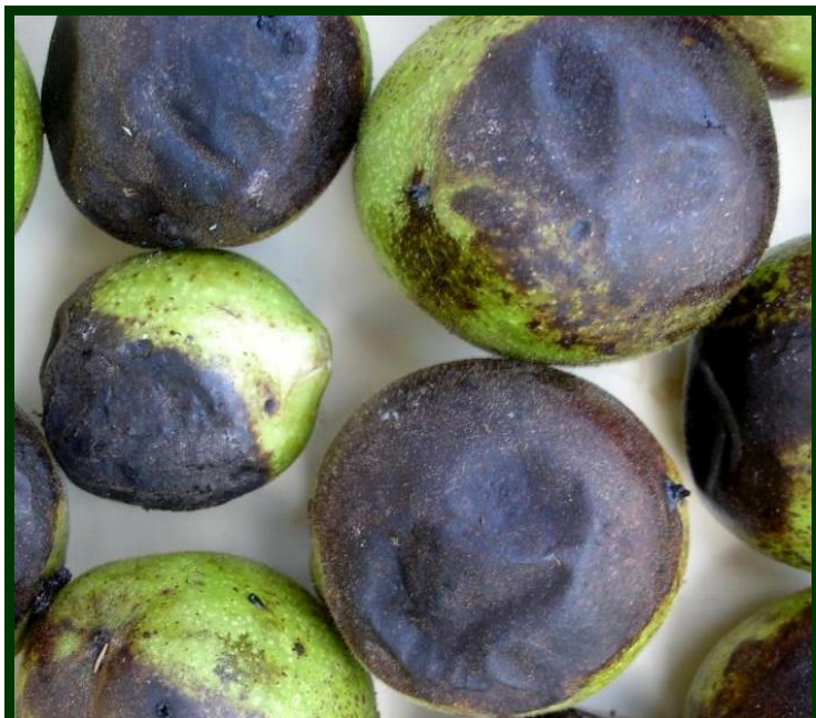
Sintomas do ataque de larvas da casca verde da noz

A mosca da casca verde só ataca o fruto, não a árvore.