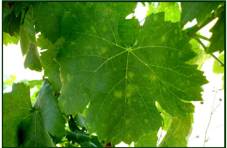
Oídio (pó branco) na folha

arejamento, contribuindo para debelar ou impedir a instalação da doença.