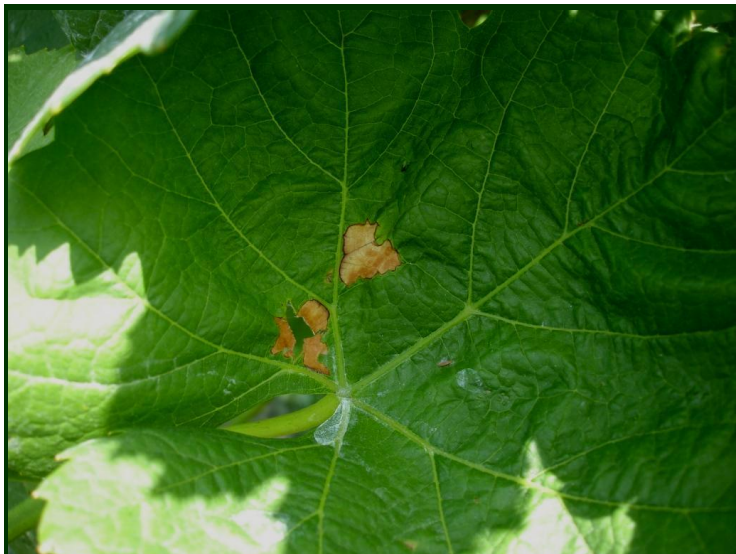
Sintomas de Black-rot na folha

Na generalidade das vinhas, há reduzidos sintomas nas folhas. No entanto, detetamos ataques significativos de Black-rot nos cachos em algumas vinhas. O fungo instalado nos bagos e folhas atacados dará origem a infeções secundárias. Se, em anos anteriores, notou alguns estragos causados por Black-rot, ou se observa agora sintomas, sobretudo nos bagos, previna a previsível expansão da doença, fazendo um tratamento específico ou aplicando um produto anti-míldio ou anti-oídio com ação contra Black-rot.