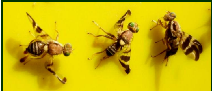
Um elemento de identificação rápida é a cor azul-esverdeada dos olhos (imagem muito ampliada)

O tratamento para combate aos adultos pode iniciar-se de imediato. Os produtos autorizados são BORAVI 50 WG (antigo IMIDAN 50 WG), DECIS TRAP COMPLETA (armadilha para captura massiva).