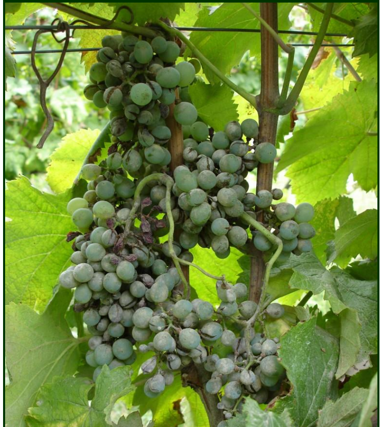
Oídio no cacho

Para combate ao oídio da videira no Modo de Produção Biológico , são autorizados fungicidas à base de enxofre.