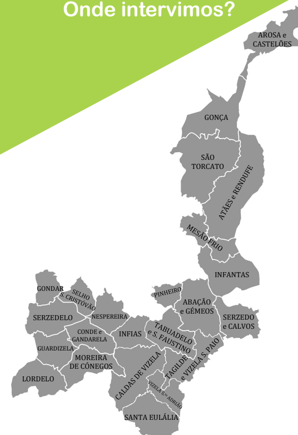
Concelho de Vizela e as freguesias de Guimarães representadas